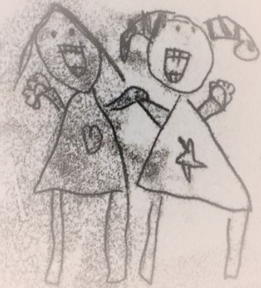
Elevarbeid, Kopervik skole, 2013

Veiledningssamtalen er en mulighet til å bli klokere sammen!