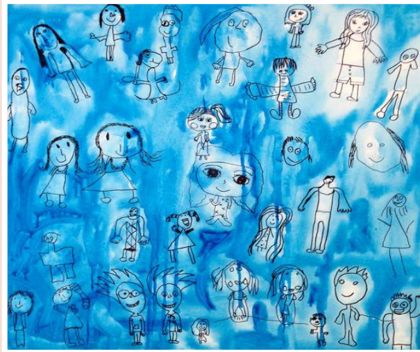
Elevarbeid, Kopervik skole, 2013